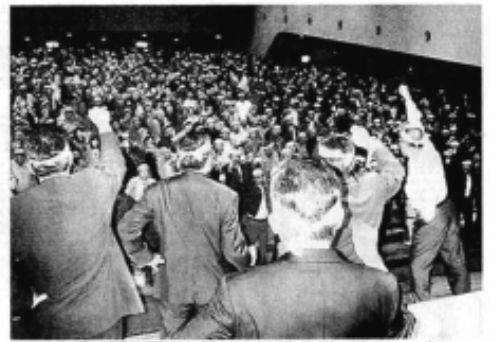
京福三国芦原線存続に向けて「カンパロー」を三唱する三国町民ら一同町社会福祉センターで 2001年11月19日（県民福井）

私には「寝耳に水」、なぜ、勝山で事故を起こしたのに、三国線が廃線になるのか！、「1年生議員だと思つてなめるな！烈火のごとく怒り、人に言えないほどの阿修羅のような闘いが始まりました。