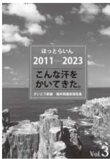
福井県議会4～6期12年 2011年～2023年