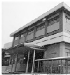
福井県立福井高等学校