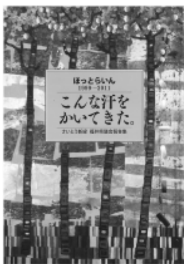
福井県議会3期12年 1991年～1999年