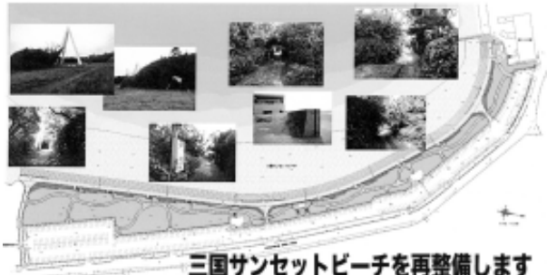
三国サンセットビーチを整備します

国の重要港湾の時は、「不 開港」で、地方港に格下げさ れてから「開港」させた全国 でも例のない港である。