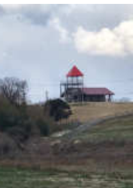
なかよしとんがり牧場

いわれています。 県議会に出てびっくりし たのは、知事から提案を受 けた議案を審議する常任委 員会の場で、大事な議案を 論議せず、その他の所管事 務を自由に論議をされていて、 最後に、時間が来ると、採決 して終わるという状況があ りました。 議会事務局に委員会の委 員長の台本の一番目に議案 審議を、その後その他につ いて、議論するよう書き換 えを求め、改善しました。 決算委員会なども徐々に 変え、少数だけで、形式的 だったものを全員で監査委 員報告を聞き、決算審査指 摘事項を最後に報告する。 私が決算委員長るとき、 現在のシステムとしました。