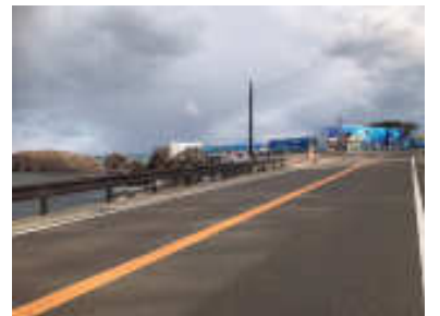
整備された三国東尋坊芦原線

越前松島水族館前の 三国町浜地く安島にか けての海岸道路は、東 尋坊へ行く観光道路で あるにも拘らず、セン ターラインもない、バ スが来るとすれ違いも できない道路だった。