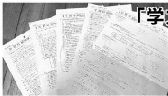
福井県の中学校で使われている教科書の過去問プリント